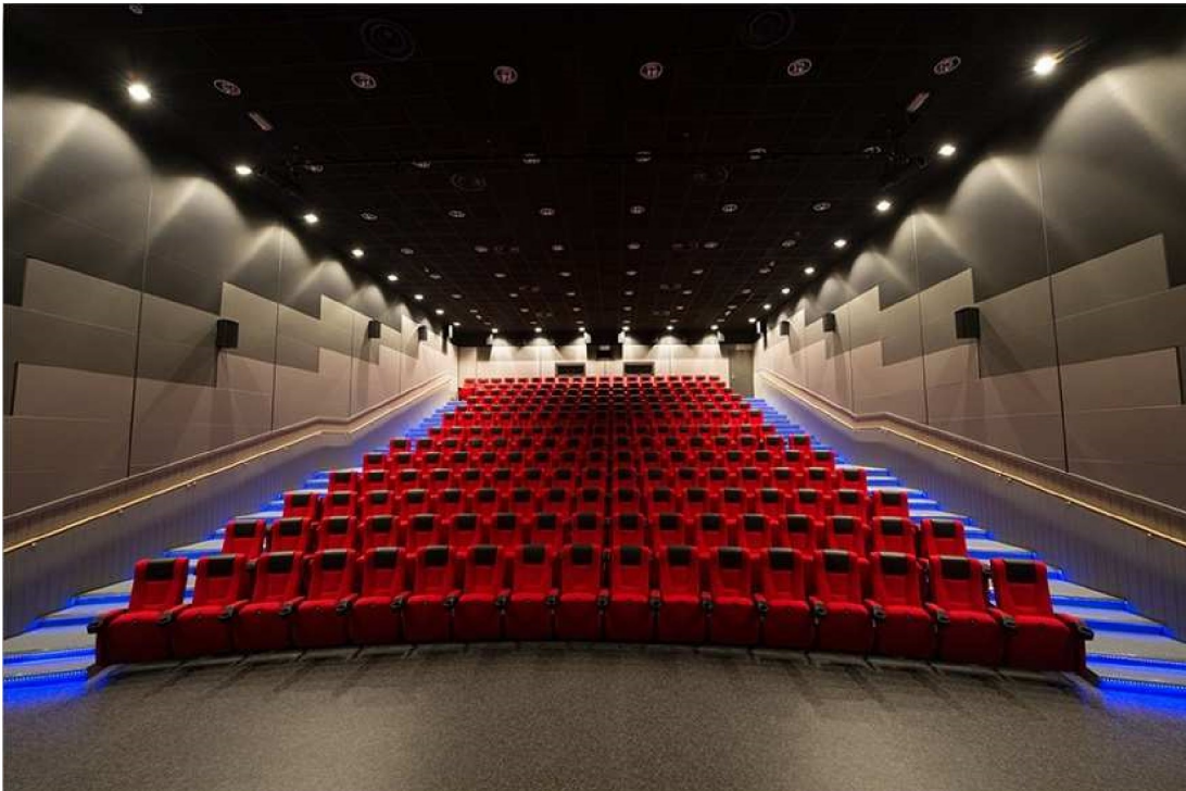
Bøs nye kulturbygg: Bø friluftsgalleri og Kultursalen, Bøhallen.